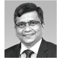
G N Ramaswami Assurance Chennai