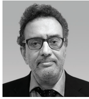
DK Giridharan Assurance Chennai